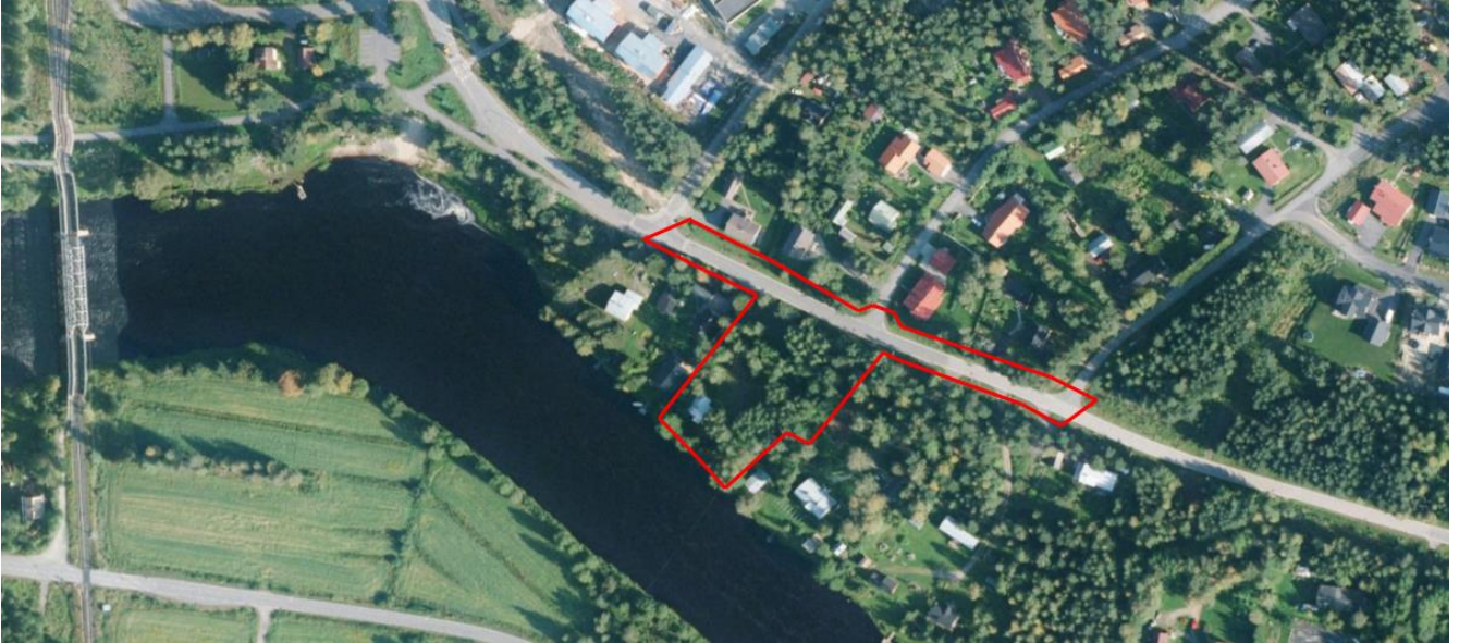
Ilmakuva suunnittelualueesta ja sen ympäristöstä 2012.

RP-tontilla on käytöstä poistettu, purkukuntoinen saunarakennus (rakennettu todennäköisesti 60 luvulla), grillikatos ja pieni varasto. Rakennukset on tarkoitus purkaa. Tontilla on rasitteena vesi- ja viemärijohtoja, jotka kulkevat Asemakyläntien varressa ja suunnittelualueen läpi naapuritontille. Lisäksi tontin läpi kulkee ilmajohtona puhelinkaapeli.